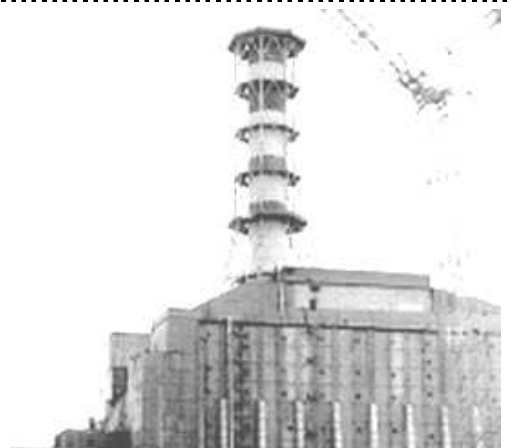
La centrale nucleare di Chernobyl

LA DATA ULTIMA PER L'ADESIONE 2008 E' IL 24 MARZO